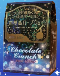
チョコレートクラッチ 540円(税込)